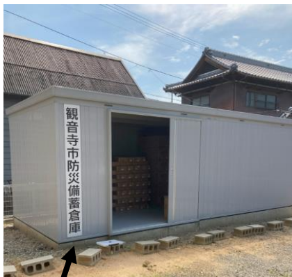
体育館の東南 市備蓄倉庫