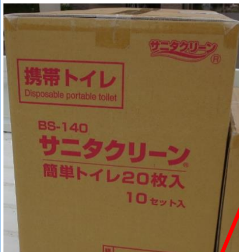
20枚入り10セットダンボール